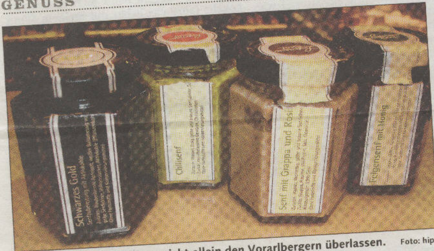
Lustenauer Senf kann man nicht allein den Vorarlbergern überlassen.