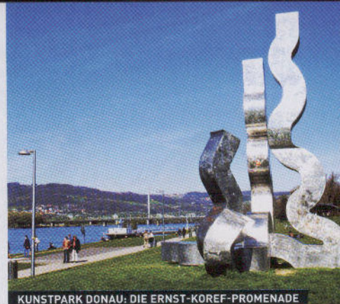
KUNSTPARK DONAU: DIE ERNST-KORF-PROMENADE