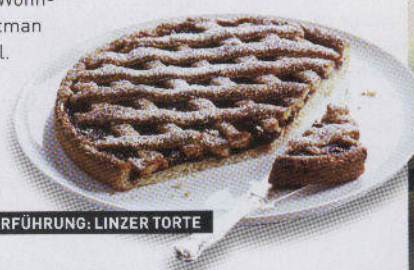
SÜSSE VERFÜHRUNG: LINZER TORTE

TOURISMUSVERBAND LINZ Hauptplatz 5, Tel. 70702009, www.linz.at/tourismus