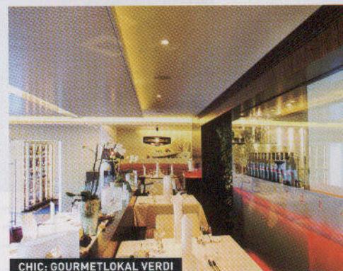
CHIC: GOURMETLOKAL VERDI